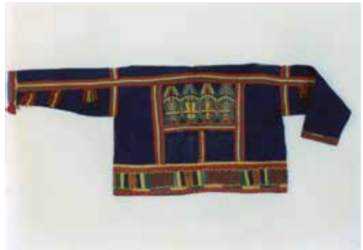
Krótka bluza Bununki