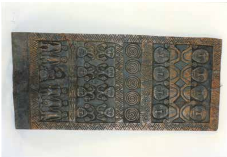
Snycerka Pajwanów