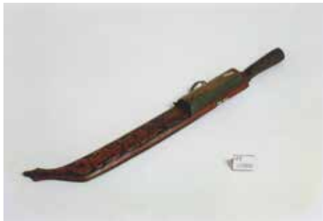
Nóż tiljak noszony dawniej przez Pajwanów