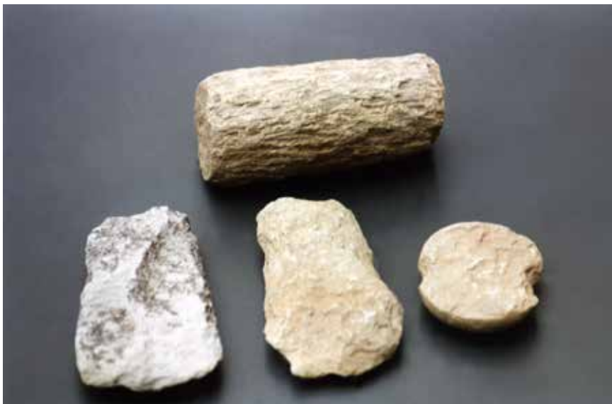
Kamienne proto-siekierki z Tajwanu (znalezione w okolicach Hsinchuang)