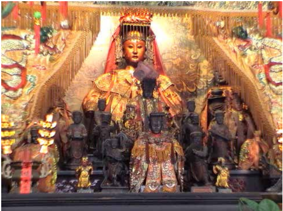
Bogini Mórz Mazu (Matsu), Lukang, Tajwan Środkowy